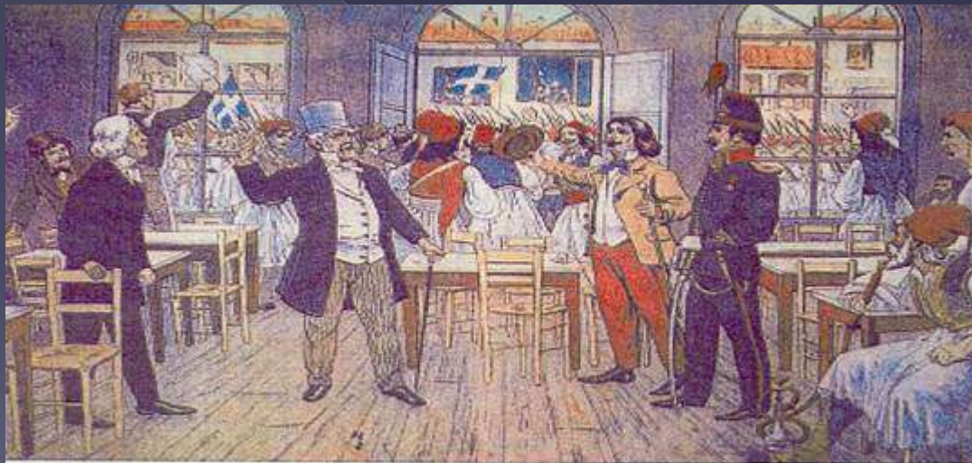
Το καφενείο η «Ωραία Ελλάδα». Εδώ χτυπούσε η καρδιά του ελληνικού Χρηματιστηρίου πριν αυτό ιδρυθεί. Ήταν ο πρόγονος των σημερινών καφενείων που έχουν φιλόσοφο μέσω Internet με τα Χρηματιστήρια.